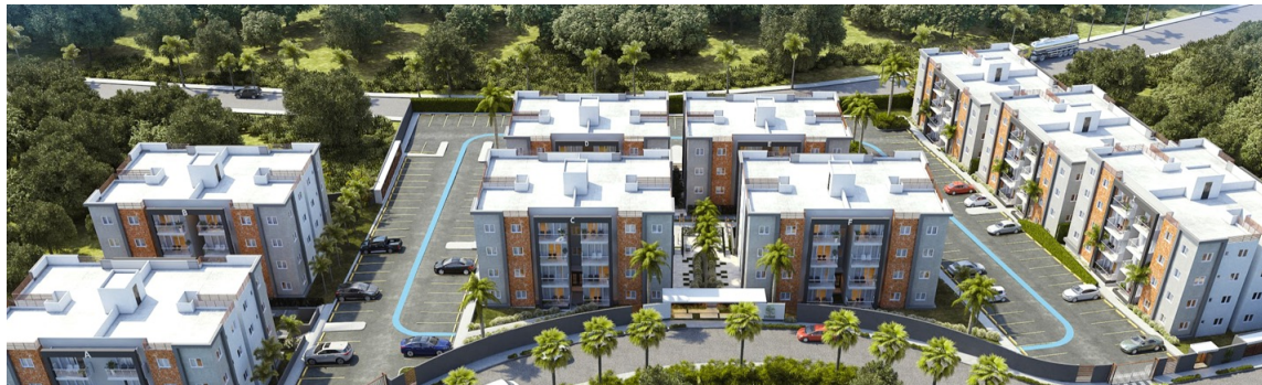
Parque de las Colinas II