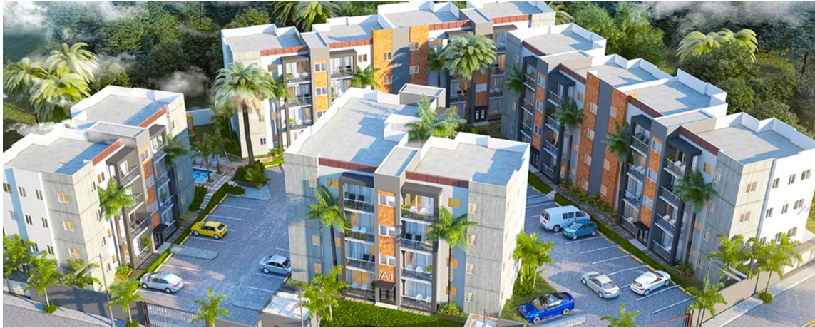
Parque de las Colinas I